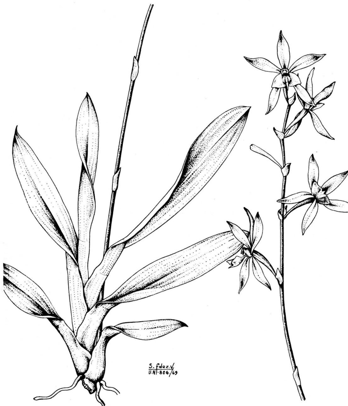
Oliveriana egregia Reichb. f.

Hábito x 4/5; Inflorescencia x 7/8. (P. V. Ortiz 76 COL).